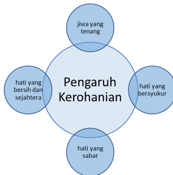
Rajah 2: Pengaruh kerohanian melalui diet halalan tayyiban

Secara rumusan, terdapat empat elemen kejiwaan yang dapat disingkap melalui aplikasi halalan tayyiban iaitu jiwa yang tenang, hati yang bersyukur, hati yang sabar serta hati yang bersih dan sejahtera. Hal ini sebagaimana disimpulkan dalam rajah 2 di bawah: