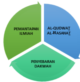
Rajah 1: Usaha Dakwah Badi' Al-Zaman Sa'id Al-Nursiy

Berdasarkan perbincangan yang dikemukakan sebelum ini, dapat dirumuskan bahawa terdapat tiga usaha dakwah utama yang dilakukan oleh al-Nursiy, iaitu menerusi pemantapan ilmiah, al-qudwat al-hasanat , dan penyebaran dakwah. Perkara ini dapat digambarkan sebagaimana Rajah 1 seperti berikut: